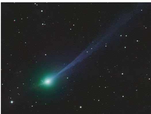
Рисунок 3 – 3I/ATLAS 19 ноября 2025.

В первой половине октября 2025 г. объект практически не наблюдался из-за близости к Солнцу. Лишь в период с 18 по 24 октября, когда объект находился в поле зрения космических коронографов (SOHO LASCO C3, CCOR-1), он был наблюдаем. 29 октября объект прошел перигелий своей орбиты на указанном выше расстоянии от Солнца. К началу ноября объект удалился от Солнца на небесной сфере достаточно далеко, чтобы продолжились его регулярные наблюдения с Земли. В это время блеск объекта достиг максимума на уровне звёздной величины +9,8. При этом наблюдались развитая диуглеродная кома диаметром около 5 угловых минут, разветвленный ионный хвост длиной до 1 градуса, а также антихвост. На рисунке 3 представлен вид объекта на 19 ноября 2025 г.