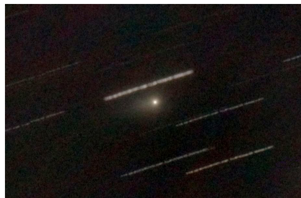
Рисунок 4 – 3I/ATLAS 24 декабря 2025. Гомель. ( m = +11,5 )

По мере удаления от Солнца блеск объекта стал постепенно снижаться. К концу декабря видимая величина объекта составляла около +11,5. Яркость зеленой диуглеродной комы и ионного хвоста стала быстро падать; на рисунке 4 уже не удастся различить ни зеленую кому, ни ионный хвост, хотя антихвост все еще остается достаточно ярким.