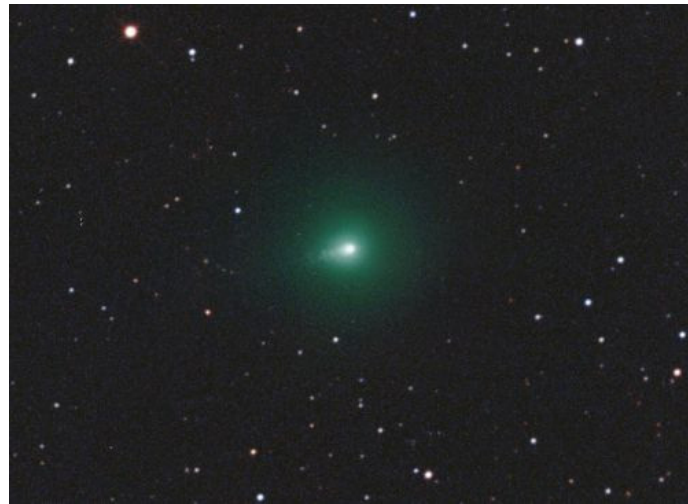
Рисунок 2 – 3I/ATLAS 24 сентября 2025. Снимок М. Егера и Г. Реманна [6]

Начиная с сентября 2025 г. у объекта наблюдалась типичная для комет зелёная кома, характерный цвет которой обусловлен наличием диуглерода. На рисунке 2 показан вид объекта 24 сентября 2025 г. В это же время наблюдался быстрый рост блеска объекта: от +15 звёздной величины в начале сентября до +12 в конце.