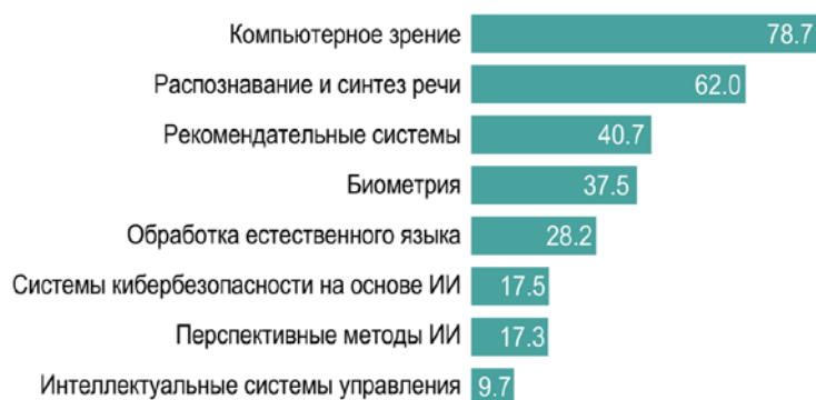
Рисунок 2 – Уровень использования основных групп технологий ИИ (в % от числа организаций-пользователей ИИ) в 2023 г.

Уровень использования основных групп технологий ИИ (в % от числа организаций-пользователей ИИ) в России в 2023 г. приводится на рисунке 2 [3].