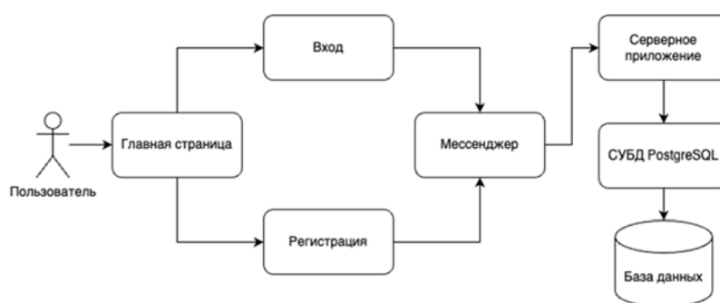
Рисунок 1 – Сценарий работы программного обеспечения

При первом использовании программного обеспечения загружается начальная страница веб-приложения, благодаря которой новый пользователь может ознакомиться с продуктом и принять решение об его дальнейшем использовании. Начальная страница веб-приложения включает нескольких частей: начальный (приветственный) блок; блок с основными функциями продукта; блок с отображением работы визуализатора LaTeX выражений; блок с часто задаваемыми вопросами о продукте.