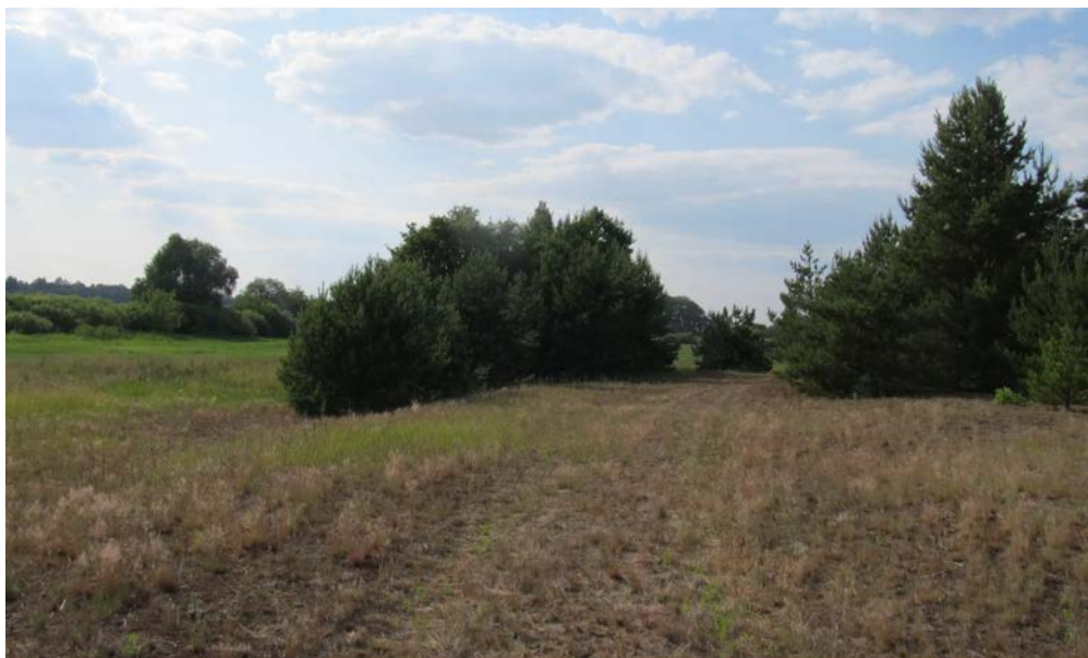
Рисунок 2 – Место обнаружения вида в Гомельском районе

Место находки ос расположено в 2,5 км восточнее р. Днепр и представляет собой открытый, хорошо прогреваемый возвышенный участок пойменного луга с разреженной разнотравно-злаковой растительностью и искусственной посадкой сосны, через которую проходит слабо наезженная автомобильная дорога (рисунок 2).